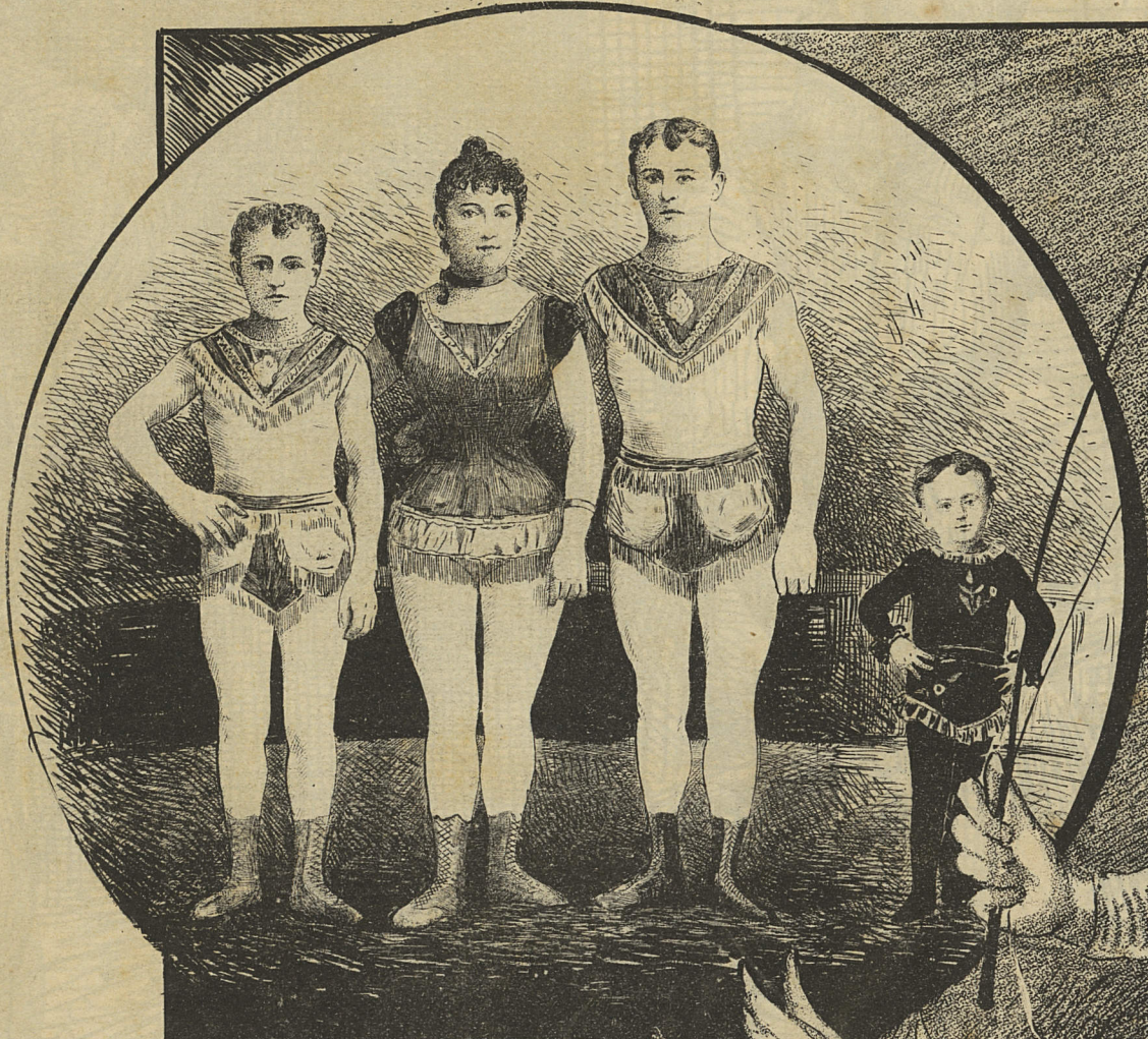
FRÈRES ET SŒUR MARTINETTI les incomparables acrobates et gymnasiarques.