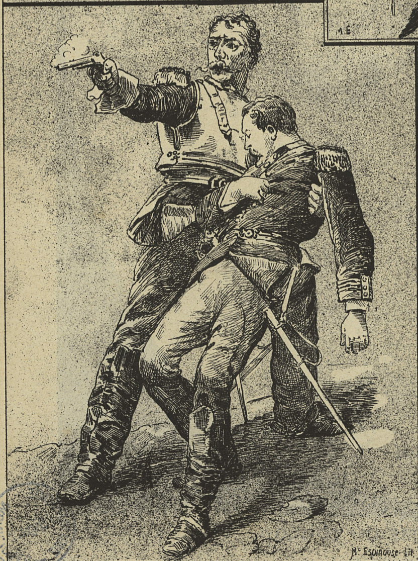
FACE A L'ENNEMI (BEAUQUESNE)