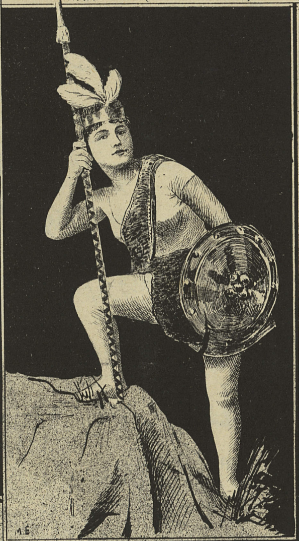
QUELQUES GROUPES DU MUSÉE VIVANT