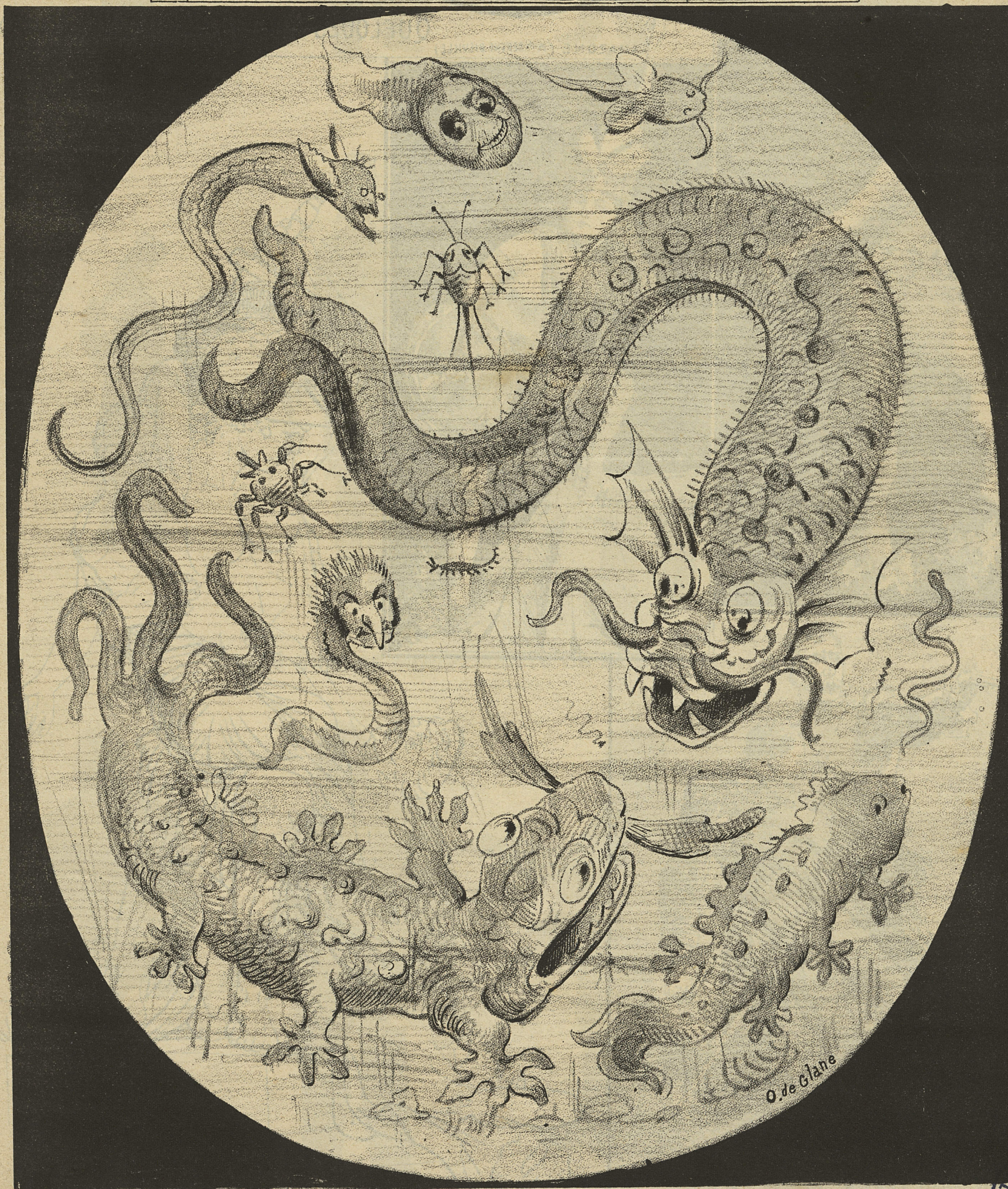
LES INFINIMENT PETITS DE L'ABIME DU TOULON

ANNONCES : 10 fr. la Case pour 12 numéros. Annonces illustrées : 20 fr.