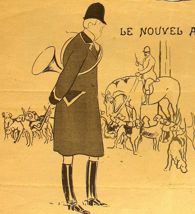
Un grand chasseur.