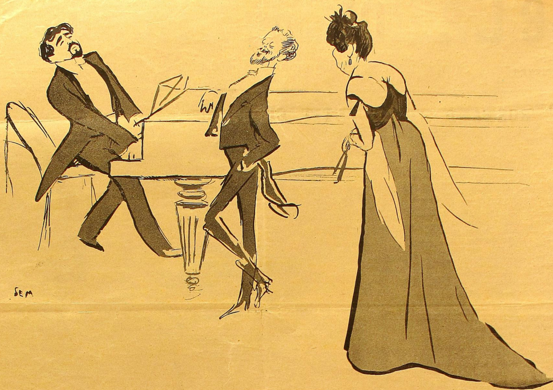
UN SALON ARTISTIQUE