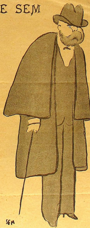
Un ancien ambassadeur.