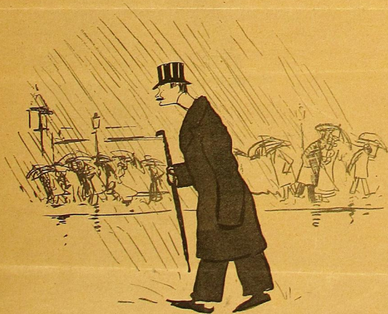
sur le boulevard