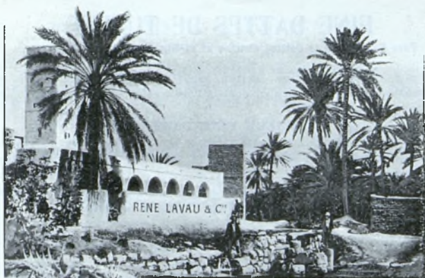
NOTRE MAISON D'APPROVISIONNEMENT DANS L'OASIS DE TOZEUR.