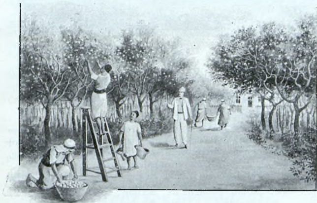
UNE DE NOS ORANGERIES.

Les prix ci-dessus comprennent, à notre charge, tous les frais d'emballage, de régie, droits de douane et transport jusqu'à la gare du destinataire.