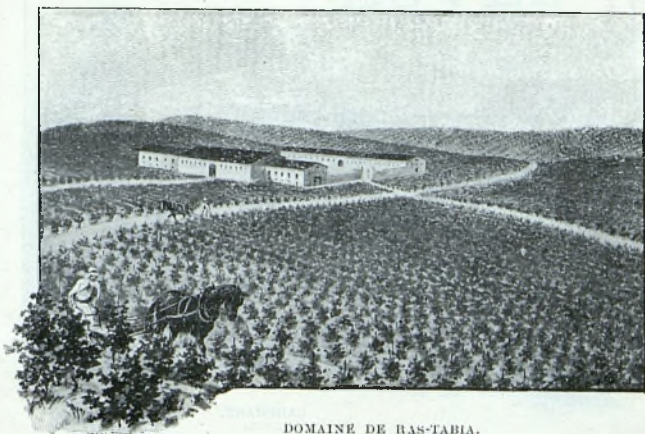
DOMAINE DE RAS-TABIA.