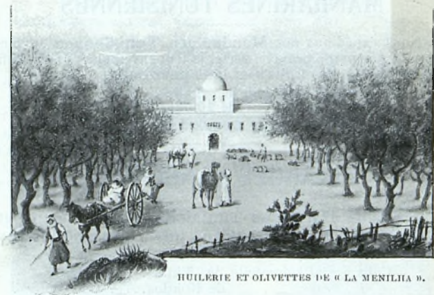
HUILERIE ET OLIVETTES DE « LA MENILHA ».