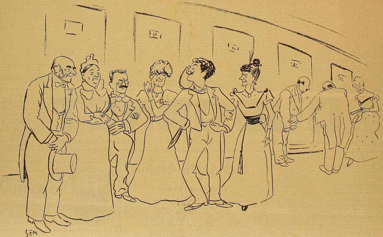
Le Jour d'Abonnement.