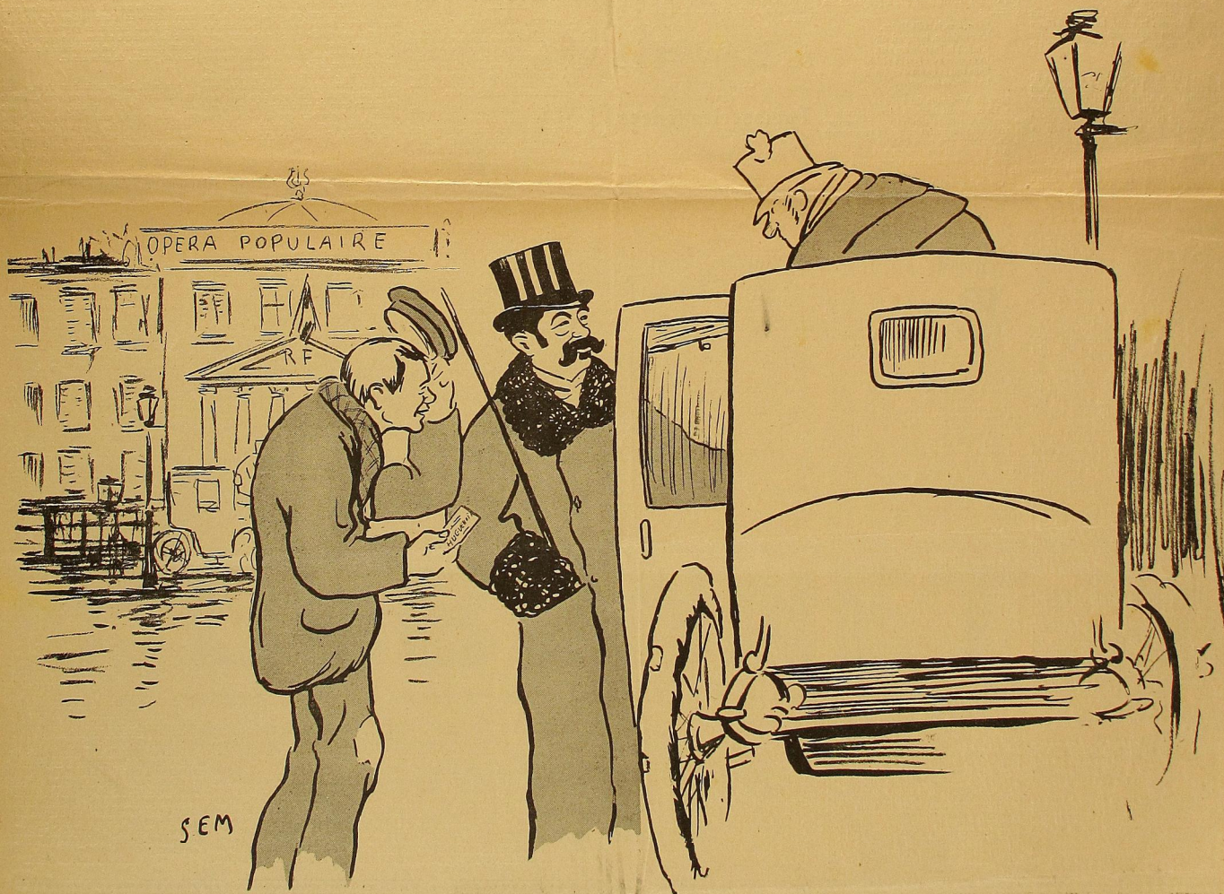
— Un bon fauteuil, mon Prince?... M. Briand. — Cocher, au Tréteau-Royal.