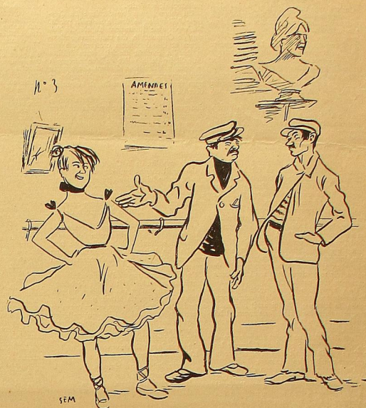
Le Foyer de la Danse.